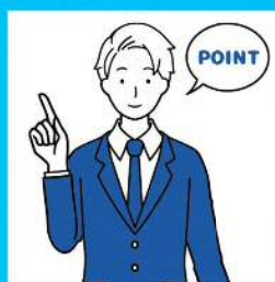
採用に関する コンサルティング