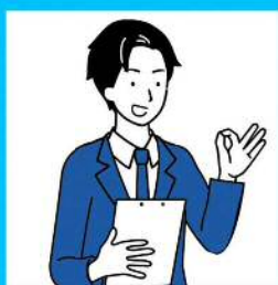
求人内容に関する 個別アドバイス