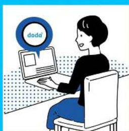
dodaへの 長期求人掲載