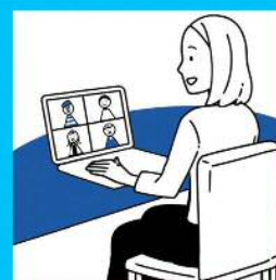
web活用に関する セミナーへの参加

dodaへの原稿掲載料は通常約100万円ですが、今回 ご負担は5万円のみ です。 さらに 人材採用の専門家によるコンサルティング を特別にお受けいただけます!